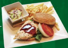
● Teriyaki Chicken Burger 照り焼きチキンバーガー - Grilled Chicken, Tomato, Onion ¥1,080