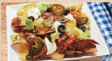
ナチョスオープン焼き Oven-baked Nachos

ビールと後継の相性のナチョスをオープンで焼き上げました アボカドとサルサの絶妙なテスト。