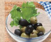
オリーブ盛り合わせ Olive bowl ¥480