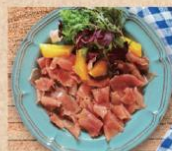
生ハム Prosciutto ¥680