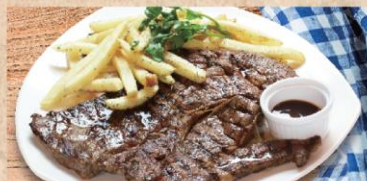
ワンポンドステーキ One Pound steak 肉食系もびっくり。ビールやワインで、皆様でおとりわけも。 ¥2,980