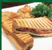
BLT Sandwich BLTサンドウィッチ ベーコン、レタス、トマトがそれぞれの 奥文字を取って「BLT」サンドウィッチ