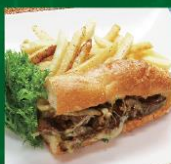
Philly Cheese Steak Sandwich フィリーチースステーキサンドウィッチ アメリカでは、バーガーと並んで人気の ファーストフードの巨匠。