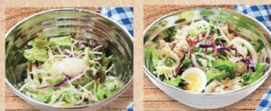
温玉シーザーサラダ Caesar salad ¥830 Peter サラダ Original salad ¥880