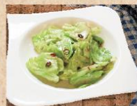
キャベツのアンチョビオイル和え Cabbage with anchovy oil ¥480