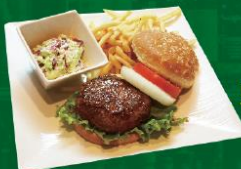
● Beef Burger ビーバーガー Beef Patty, Onion, Tomato, Lettuce ¥1,480