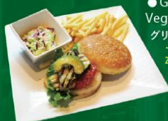
● Grilled Vegetable Burger グリルドベジタブルバーガー - Grilled Onion, Tomato, Zucchini, Eggplants, Lettuce ¥1,180