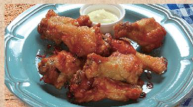
Buffalo wing バッファローチキンウィング 4本 ¥780 8本 ¥1,280